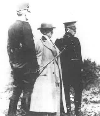
Bezoek van koningin Wilhelmina aan de troepen te Gorssel, 1916

De Belgische hoogleraar Eliane Gubin bespreekt in haar artikel het onderzoek dat tot nu toe is verricht naar sekse en oorlog in België ten tijde van en vlak na de Eerste Wereldoorlog. Het artikel is beschrijvend van aard omdat het onderzoek nog lopende is, aldus Gubin. Een van de stellingen is dat in België, vanwege het feit dat het land snel onder de voet gelopen werd, nooit een beroep op vrouwen gedaan is om de opgevallende arbeidsplaatsen van mannen in te nemen. Toch zou de oorlog volgens de auteur de verhoudingen tussen de seksen radicaal verstoord hebben "niet door de afwezigheid van een van beide seksen, maar door hun