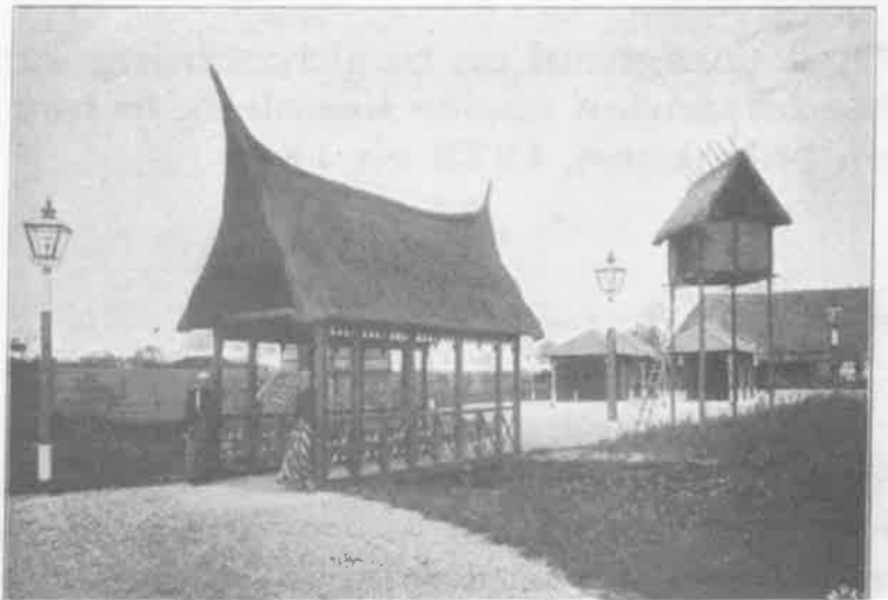
Detail ansichtkaart

waren en aantonen dat vrouwen zelfstandig denkende en handelende wezens waren, en niet in alles afhankelijk van mannen. Om dat voor elkaar te krijgen was samenwerking en solidariteit onder vrouwen noodzakelijk. Pas dan zouden vrouwen een kracht van betekenis kunnen worden. De meer bevoorrechten onder hen zouden het op moeten nemen voor haar minder bevoorrechte zusters.