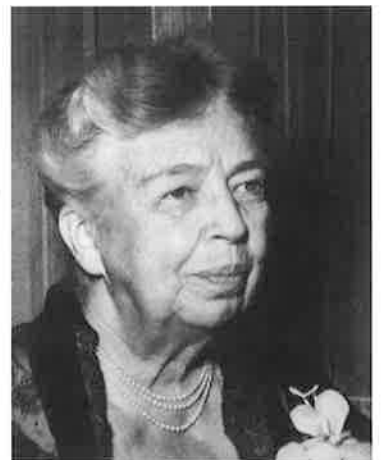
Eleanor Roosevelt

Omdat Eleanor Roosevelt geen gekozen ambt bekleedde, kon zij zich principiëler opstellen dan de president en zijn adviseurs. Eleanor verklaarde later dat zij zelf de agitator was die FDR, de raspoliticus, aanspoorde. Via haar krantecolumn My Day , die zes maal per week verscheen, was zij in staat om haar standpunten doeltreffend uiteen te zetten. FDR gebruikte Eleanor en haar column regelmatig om politieke proefballonnetjes op te laten. Het grote politieke voordeel hiervan was dat FDR altijd nog kon zeggen dat hij niets met haar kon aanvangen: "poor thing, she's just made that way." Op die manier kon hij bepalen hoe ver hij kon gaan.