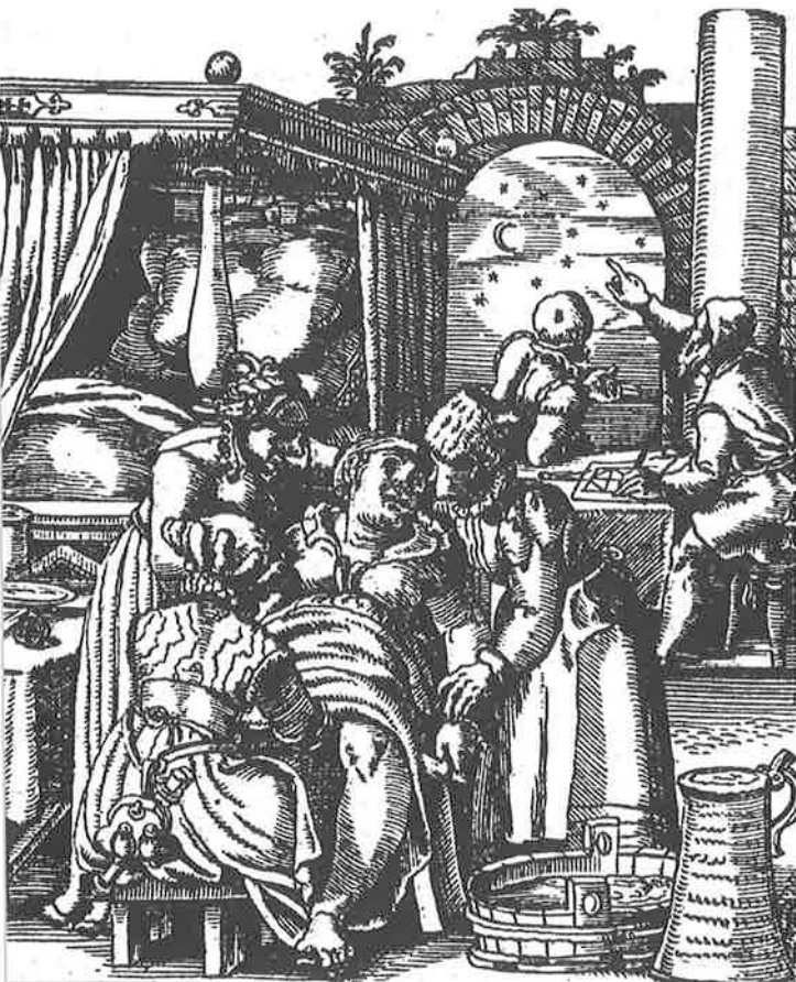
(Rueff, 't Boeck van de vroegtwijfels, Amsterdam, 1591, p. 26)

Naast de mening van vroedmeesters en geneesheren waren er ook nog andere factoren die van invloed waren of konden zijn