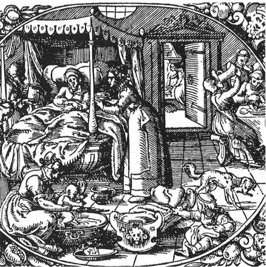
(Rueff, 't Boeck van de vroedtwijfels, Amsterdam, 1591, titelpagina)

op de beeldvorming en reputatie van vroedvrouwen. In dit artikel ga ik nog kort in op de relatie tussen vroedvrouwen en hekserij die in mijn ogen van belang was voor de beeldvorming.